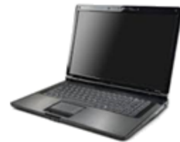
PC (解析ソフトウェア付属)