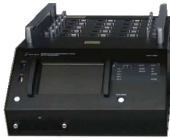
データ解析処理装置: 7904A-001 (ELT-400 専用接続ケーブル付属)